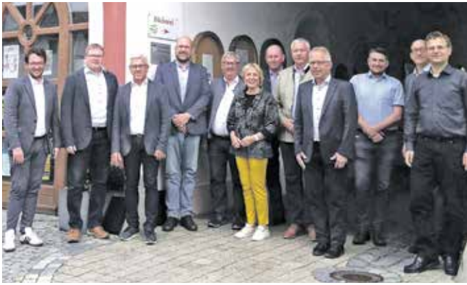
Vertreter der Mitgliedsgemeinden der ILE Klosterwinkel am Ende ihrer Sitzung in Ortenburg

ILE Klosterwinkel diskutiert über Belastungsgrenzen ländlicher Kommunen