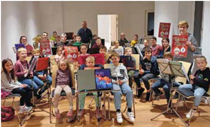
Gemeinsam mit „den Großen“ von der Jugend-Blaskapelle üben die Saxonettenschüler fürs diesjährige Adventskonzert

wieder Plätze frei für Saxonettenunterricht