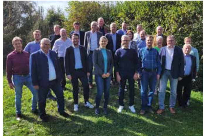
Einen fruchtbaren Erfahrungsaustausch mit vielen anregenden Einzel- und Gruppengesprächen hatten die Mitglieder der ILE Klosterwinkel bei ihrer Arbeitsklausur am 08./09. Oktober

Anfang Oktober trafen sich die Mitglieder der ILE Klosterwinkel zu einer internen Arbeitsklausur in Vilsbiburg. Ziel des zweitägigen Treffens war es, das seit fünf Jahre bestehende „Integrierte Ländliche Entwicklungskonzept“ (ILEK), welches die Arbeitsinhalte der ILE vorgibt, zu aktualisieren.