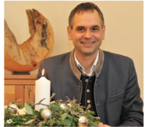
Ihr Raimund Kneidinger Landrat des Landkreises Passau

der Rückblick auf ein Jahr kann sehr unterschiedlich ausfallen. Ihnen allen wünsche ich, dass beim Blick auf 2024 Zufriedenheit und Dankbarkeit überwiegen. Gehen Sie voller Zuversicht ins neue Jahr. Im Namen des Landkreises Passau und auch ganz persönlich wünsche ich Ihnen eine friedliche Weihnachtszeit und für 2025 Glück und vor allem Gesundheit.