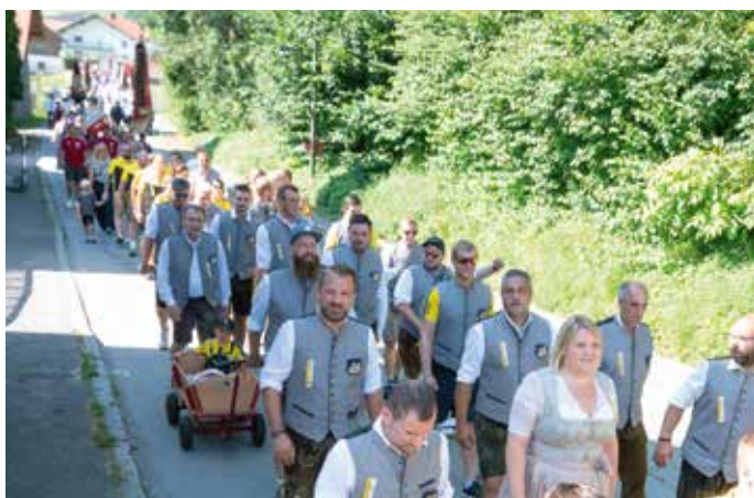
Ein langer Festzug zog am Sonntag zur Pfarrkirche St. Georg in Beutelsbach zum gemeinsamen Jubiläumsgottesdienst - allen voran der SV Beutelsbach als Jubelverein

Der Sonntag gebührte den Jubiläumsfeierlichkeiten des SV Beutelsbach, die mit Salutschüssen der Böllergruppe der Reschndölschützen Beutelsbach eröffnet wurden.