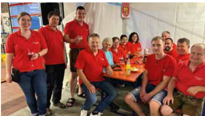
Ein kleiner Teil der fleißigen Dorffest-Helfer

Engeläutet wurde das Dorffest 2024 am Samstag mit einem heftigen Windstoß, der den heuer zum ersten Mal aufgebauten „Kinderspielbereich“ ordentlich durcheinanderwirbelte und auch einige Sonnenschirme aus den Ständern hob. Schnell ins Zelt geflüchtet bildeten sich dann gemütliche Runden und das Dorffest war gut besucht. Am nächsten Tag ging es wettertechnisch leider so weiter: Nachdem der Außenbereich aufgebaut war, begann es wie aus Eimern zu schütten und es füllte sich das Feuerwehrhaus, das Vorzelt und auch der Innenbereich des DGHs. Der Stimmung tat dies aber keinen Abbruch und es wurde ausgelassen gegessen, getrunken und das Dorf gefeiert.