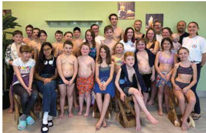
Der jugendlichen Wahlberechtigten mit den alten und neu gewählten Jugendvertretern sowie dem Wahlvorstand

Eine gute Übung in Demokratie und Wahlrecht ergab sich für die Jungmitglieder bei der Jugendleitungswahl im sonn-täglichen Training der Wasserwacht. Zwischen den Trainingseinheiten der Wassergewöhnung für Schwimmanfänger um 9.30 und dem Training der beiden Gruppen der erfahreneren Schwimmer um 10.30 Uhr war die vierjährig stattfindende Wahl der Jugendleitung angesetzt. Alle wahlberechtigten Jungmitglieder der Ortsgruppe Aidenbach zwischen 6 und 16 Jahren waren aufgerufen, Ihre Jugend- und Gruppenleitungen selbst zu wählen. Die Aufgabenstellung der Jugendleitung hat innerhalb der Vorstandschaft dabei einen wichtigen Schwerpunkt im Training selbst, darüber hinaus aber auch die sonstige Jugendarbeit mit Ausflügen, Ferienprogramm, Bastelangeboten, Weihnachtsfeier etc. Darüber hinaus natürlich auch die Zusammenarbeit mit der Kreisjugendleitung der Wasserwacht.